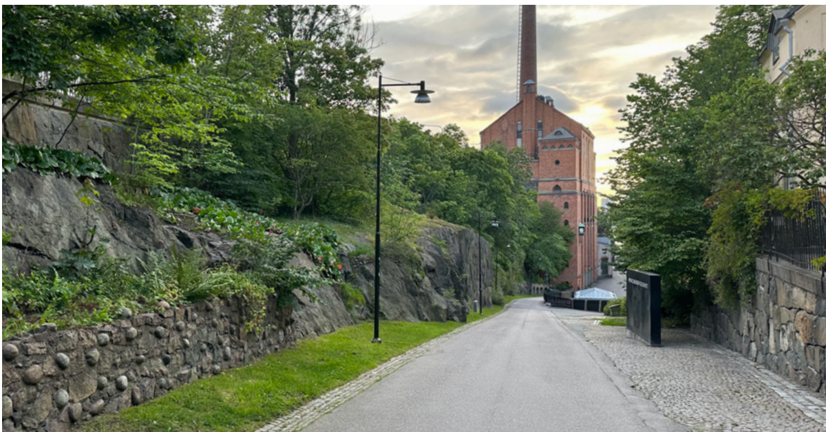
Gång- och cykleramp med terrassering ner mot bryggeriet.

De gröna ytorna i staden krymper oroväckande. Med bygget skulle sex skyddsvärda träd på den södra slänten fällas och den gröna korridoren mellan Skinnarviksparken och Mariaberget skäras av. Där rör sig fridlysta fladdermöss, fyra hotade fågelarter och en mångfald av däggdjur och insekter.