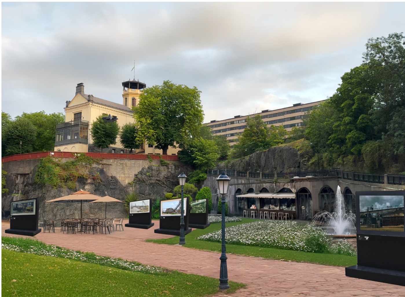
Skiss på kulturparken