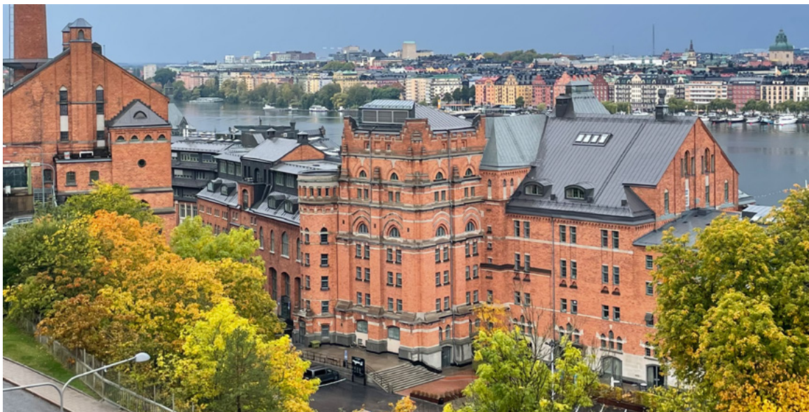
Münchenbryggeriets södra sida. Stockholms stad vill tillåta att AFA-fastigheter bygger två sjuvåningshus på just södra sidan av Münchenbryggeriet.