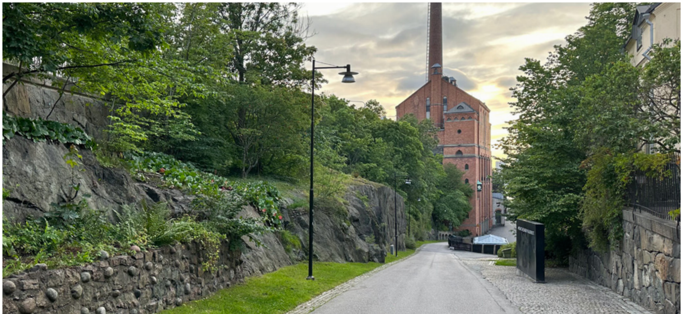
Gång- och cykleramp med terrassering ner mot bryggeriet.

Rapporter vittnar om att de gröna ytorna i staden krympt oroväckande. Med bygget skulle den enda gröna korridoren mellan Skinnarviksberget och Mariaberget försvinna. Små grönområden som sitter ihop, gör stor nytta för spridning av fröer och passage för harar, ekorrar, fladdermöss och andra arter.