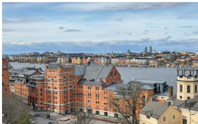
Vy från Ludvigsbergsgatan idag.

För de många som promenerar nedför rampen längs med den terrasserade muren, breddar sig snart vyerna mot City och Kungsholmen på vägen mot Högalidskyrkan.