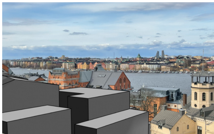
Om det byggs.