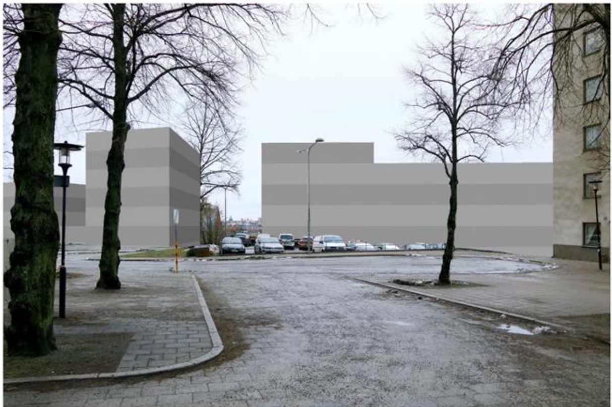
Ny bebyggelse enligt förslag från AFA fastigheter. Illustrerad vy från Ludvigsbergsgatans övre del. Foto och montage: Pär Eliaeson.